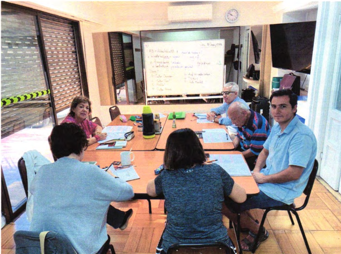
T.6 La Capitanía. MIE 09:00 – 11:00