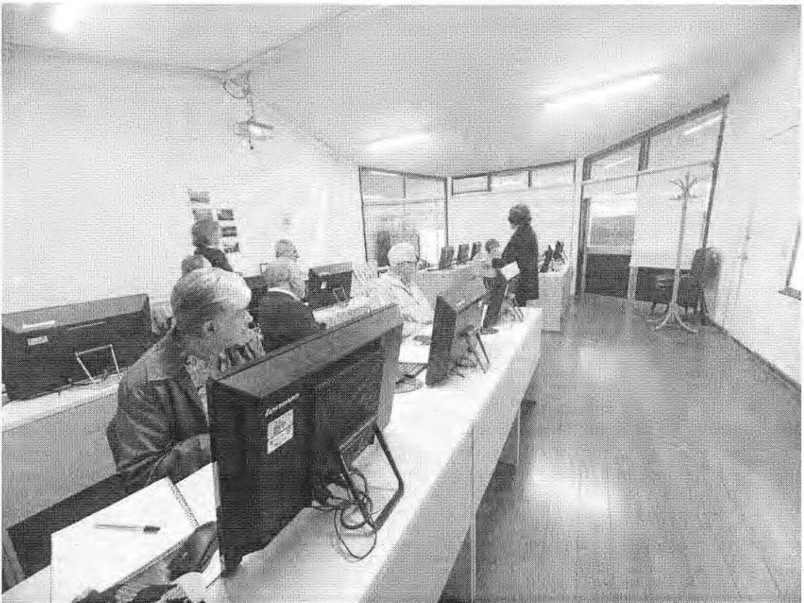
EL CANELO 09:00 – 11:00 HRS.