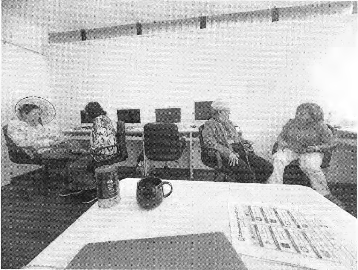
ZANZIBAR PONIENTE 11:30 – 13:30 HRS.

Se debe especificar el taller correspondiente al medio de verificación.