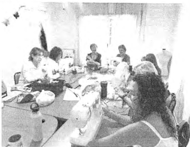
Taller Patchwork y acolchado, miércoles.