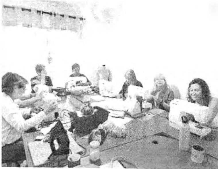
Taller de Patchwork y acolchado, miércoles.