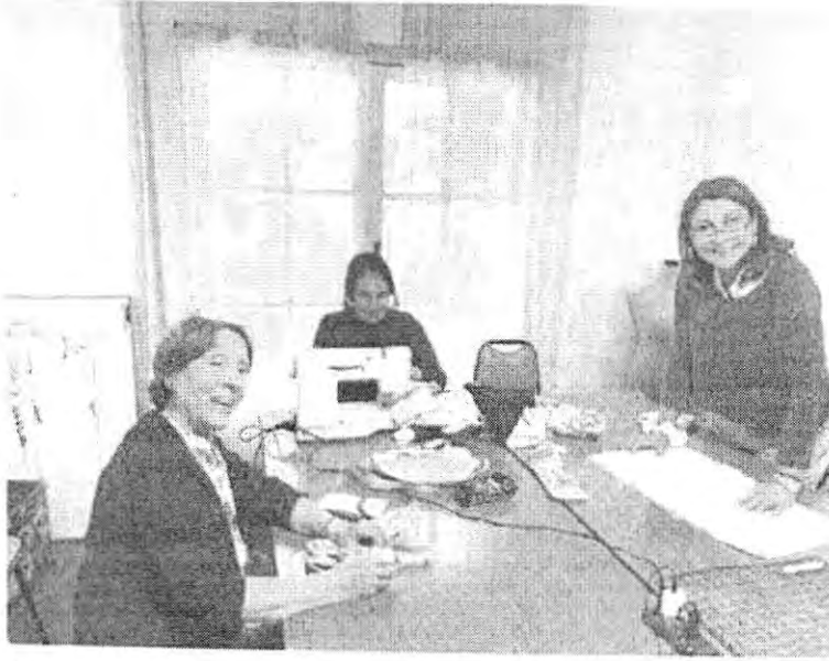
Taller de reciclaje, martes.