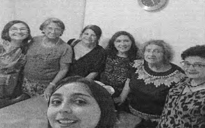
T.8 AMIGURUMI BASICO