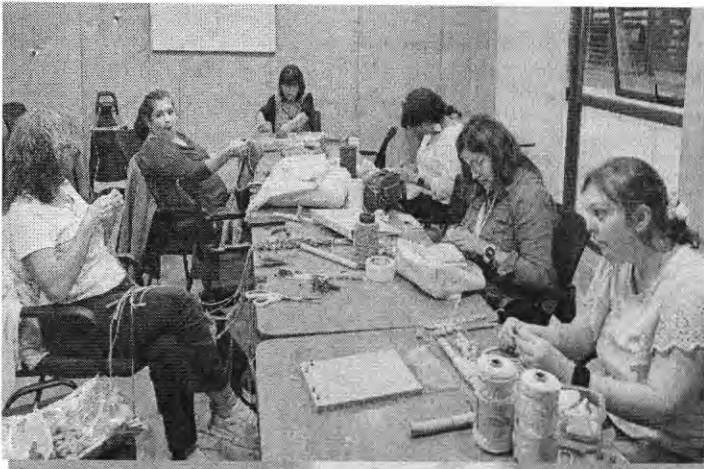
T.11 MANDALAS BASICO