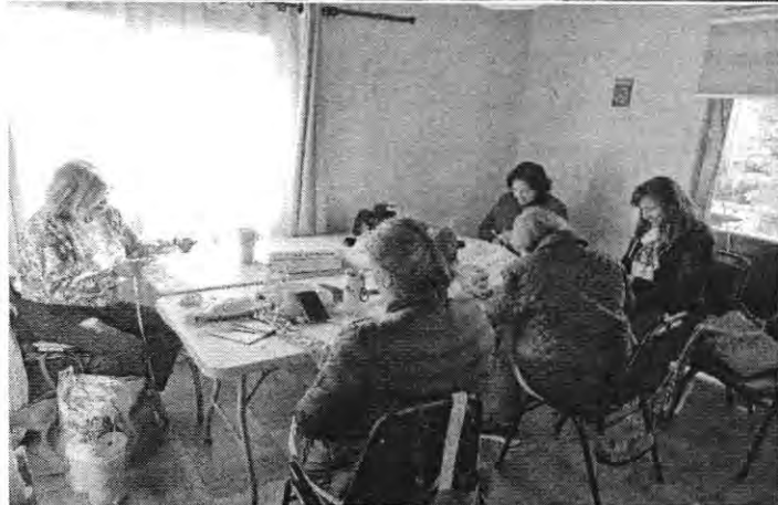
T.13 MACRAME BASICO