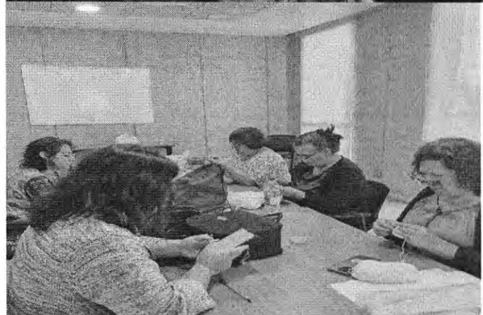
T.15 AMIGURUMI BASICO