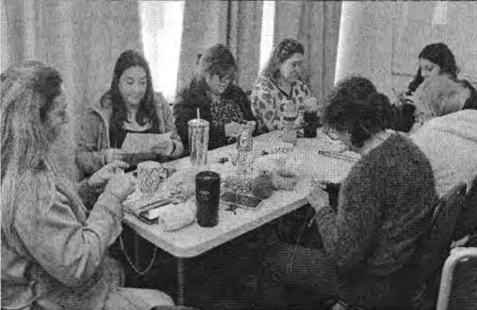
T.9 AMIGURUMI BASICO