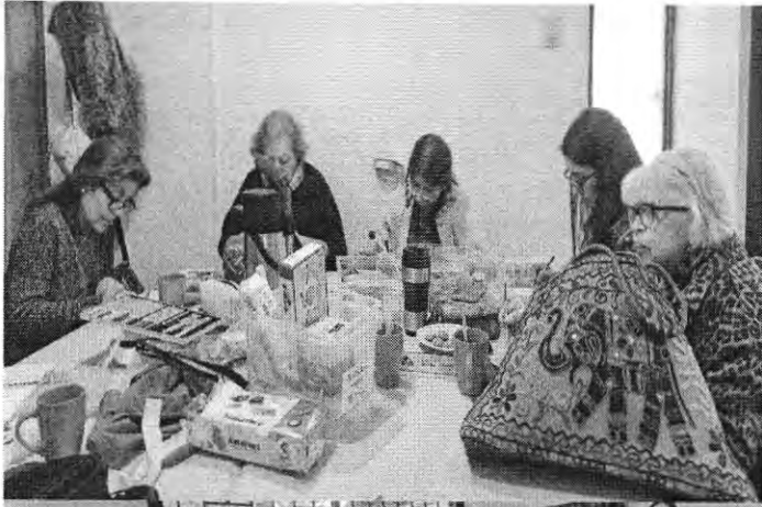
T.6 BISUTERIA MIYUBI