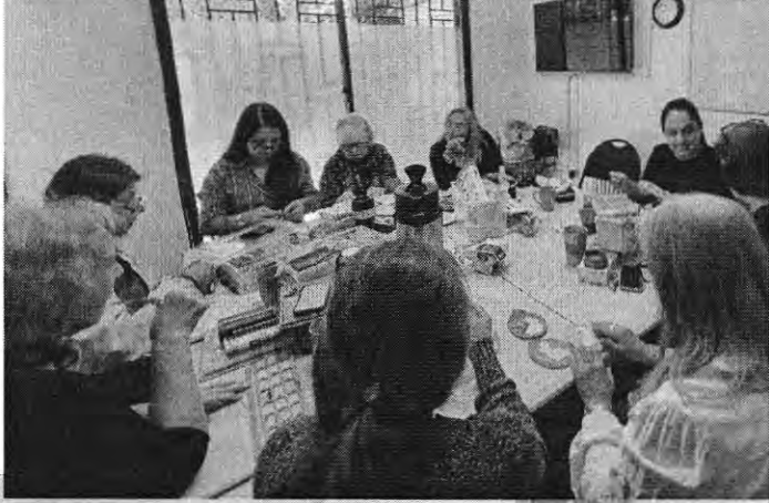
T.7 BORDADO EN PEDRERIA BASICO