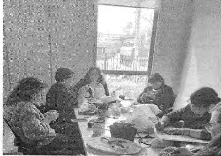
T.12 AMIGURUMI BASICO