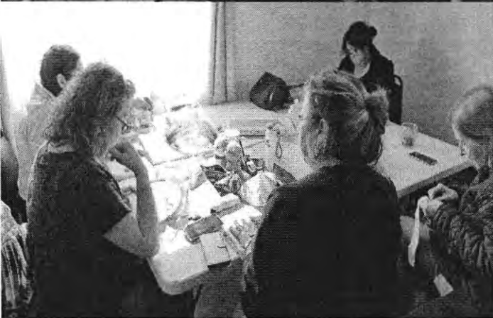
T.10 BORDADO EN CINTA BASICO