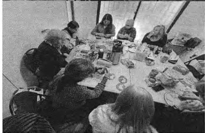
T.14 BORDADO EN PEDRERIA BASICO