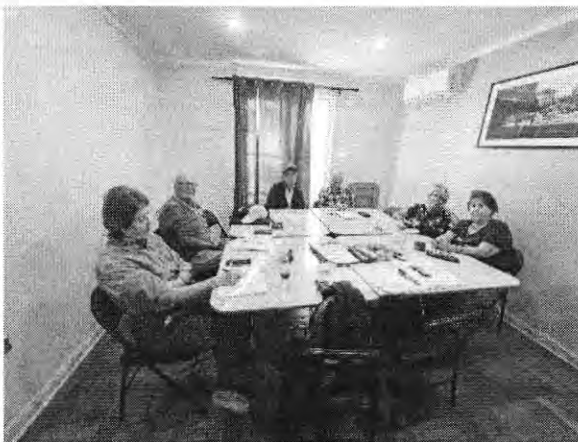
Alcántara 434 (C2) – Lu 17:15 a 19:15