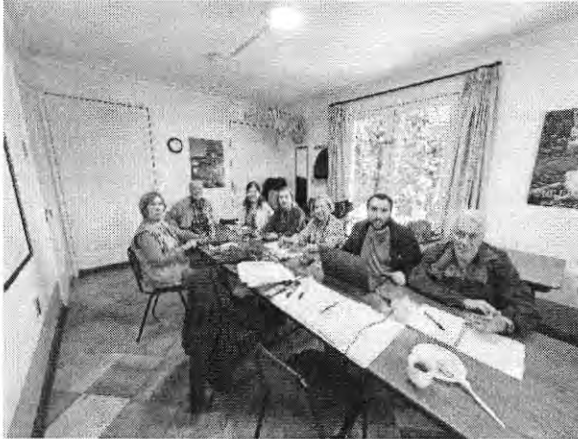
Juan de Austria 1539 (C3) – Lu 11:15 a 13:15