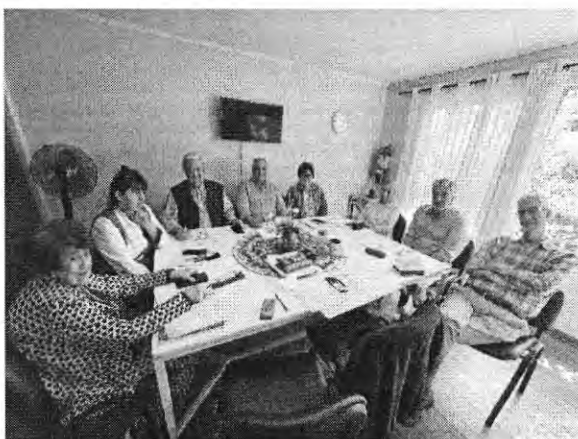
La Rábida 5300 (C5) – Ma 11:30 a 13:30