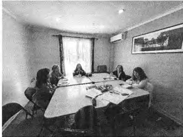
Alcántara 434 (C2) – Lu 15:00 a 17:00