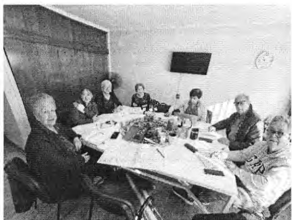
La Rábida 5300 (C5) – Ma 09:15 a 11:15