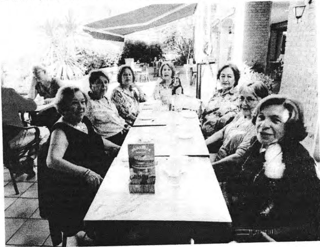
Convivencia de las alumnas con su profesora de Biodanza.

Se debe especificar el taller correspondiente al medio de verificación.