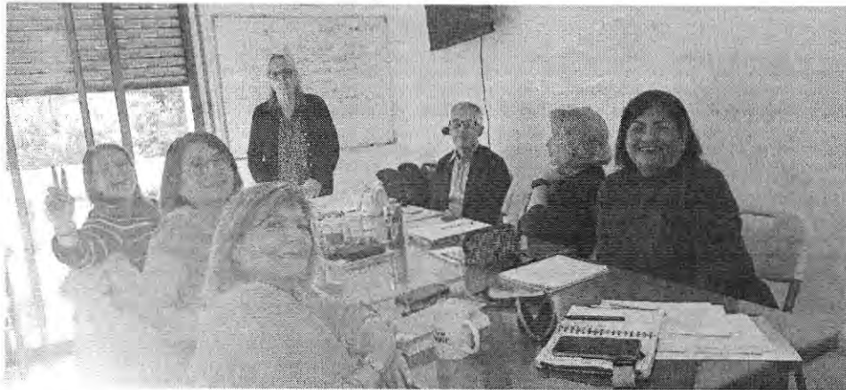
Taller Francés intermedio, La Capitanía 255, Junta de vecinos n° 7, Plaza del Inca.

Se debe especificar el taller correspondiente al medio de verificación.