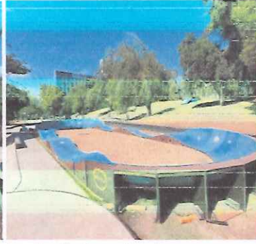
Instalación Pump Truck