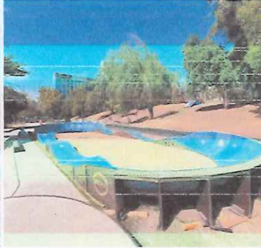
Instalación Pump Truck