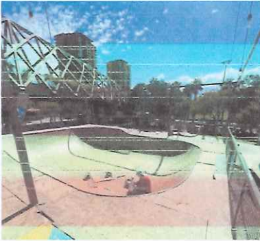
Reparación de Bowl