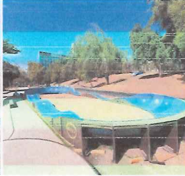
Instalación Pump Truck