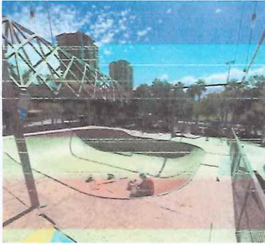
Reparación de Bowl