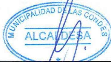
CATALINA SAN MARTÍN CAVADA