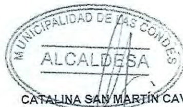
CATALINA SAN MARTÍN CAVADA Alcaldesa Municipalidad de Las Condes