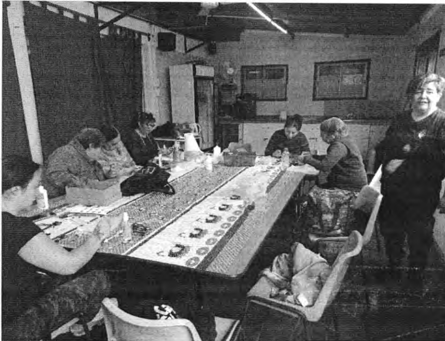
Bisuteria en porcelana

Se debe especificar el taller correspondiente al medio de verificación. porcelana en frio basico