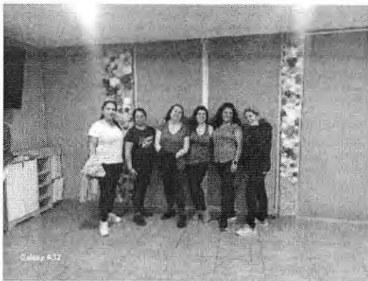
ZUMBA LAS CONDESAS 5