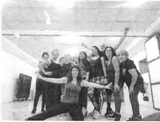
ZUMBA LAS CONDESAS 1 LOS 2 TALLERES

Se debe especificar el taller correspondiente al medio de verificación.