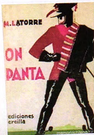
1935 por Ediciones Ercilla. Contiene 2 cuentos (On Panta