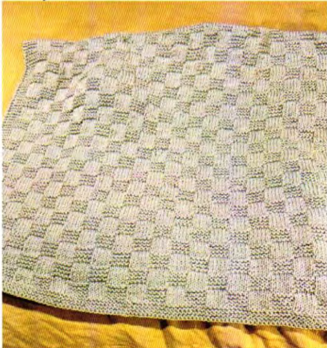
Chal de Guagua (Punto Cesta agujas)