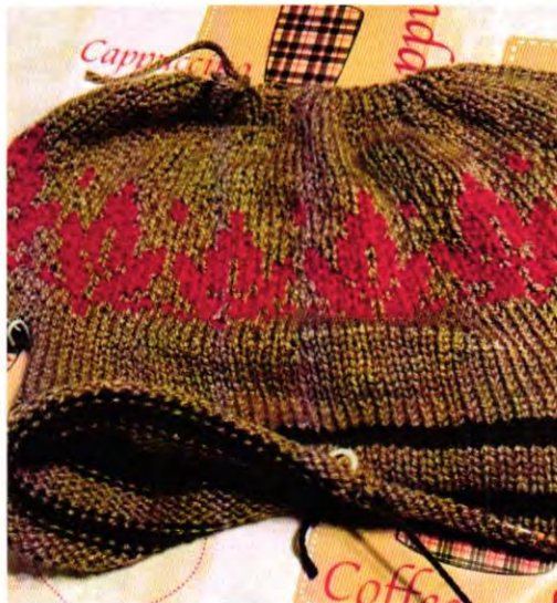
Sweater en técnica de jacquard (Agujas circulares)