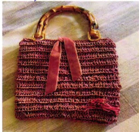
Cartera de viscosa (Crochet)