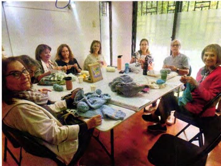
Curso Avanzado Foto del Jueves 23/04/2026