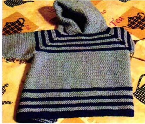
Tejido Top Down sin costuras (Agujas circulares) Martes 11 a 13 hrs