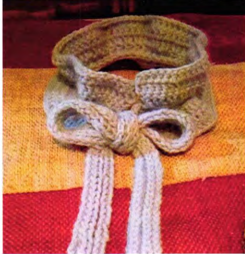
Cuello en técnica mixta (Palillos y Crochet)