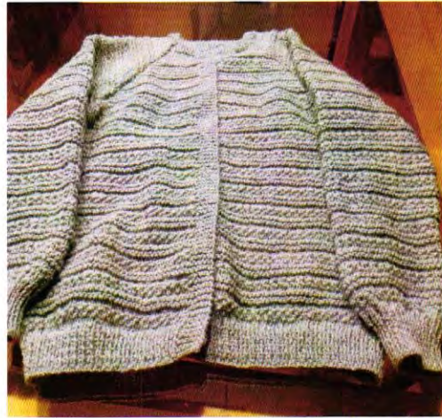
Chaleco de Adulta (Puntos fantasía) Martes de 11 a 13 hrs