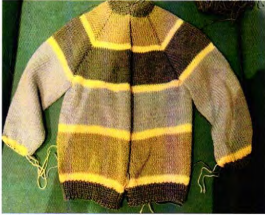
Cardigan de niña Tejido Top Down (Agujas circulares) Miércoles 11 a 13 hrs