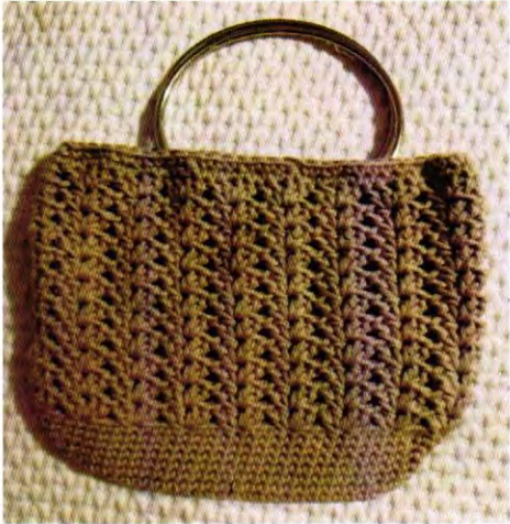
Cartera algodón (Punto Abanico) Miércoles de 11 a 13 hrs