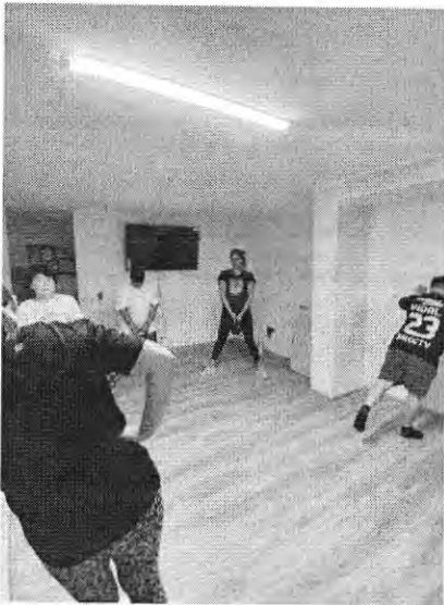
Gimnasia entretenida lunes y viernes de 19:00 a 20:00 Kennedy 4917 (edificio K1)