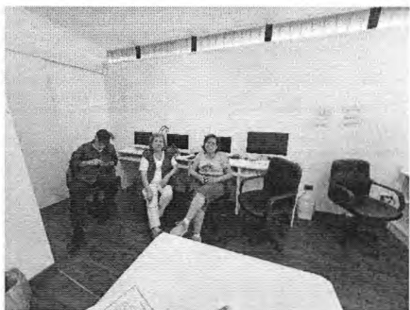
Zanzibar Poniente 7024 (C17) – Mi 11:00 a 13:00