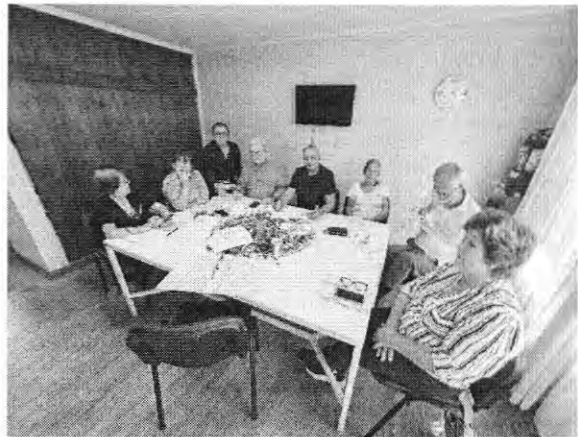
La Rábida 5300 (C5) – Ma 11:30 a 13:30