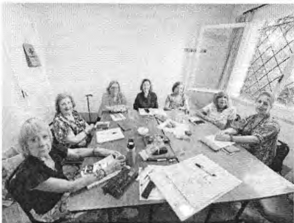
Juan de Austria 1539 (C3) – Ma 15:00 a 17:00