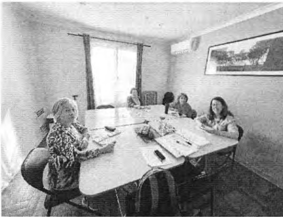
Alcántara 434 (C2) – Lu 15:00 a 17:00