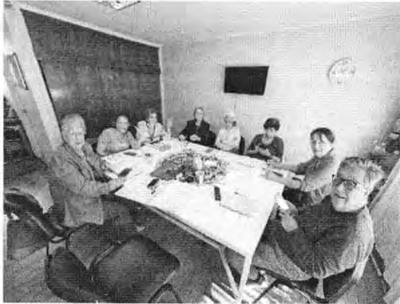
La Rábida 5300 (C5) – Ma 09:15 a 11:15