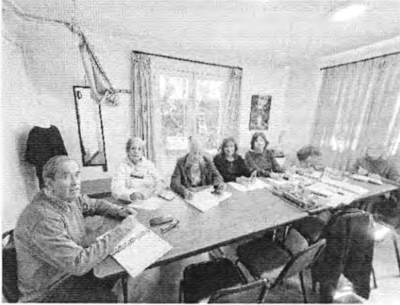
Juan de Austria 1539 (C3) – Lu 09:00 a 11:00