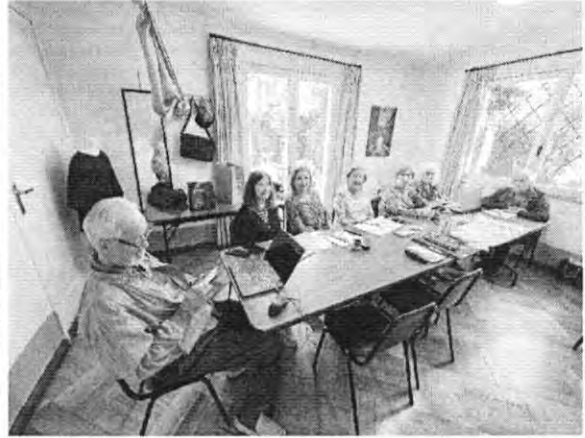
Juan de Austria 1539 (C3) – Lu 11:15 a 13:15