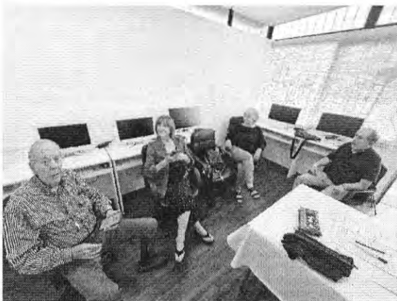
Zanzibar Poniente 7024 (C17) – Mi 14:00 a 16:00