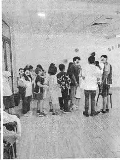
Registro de taller “Zorzalitos de Las Condes”, Abril 2026