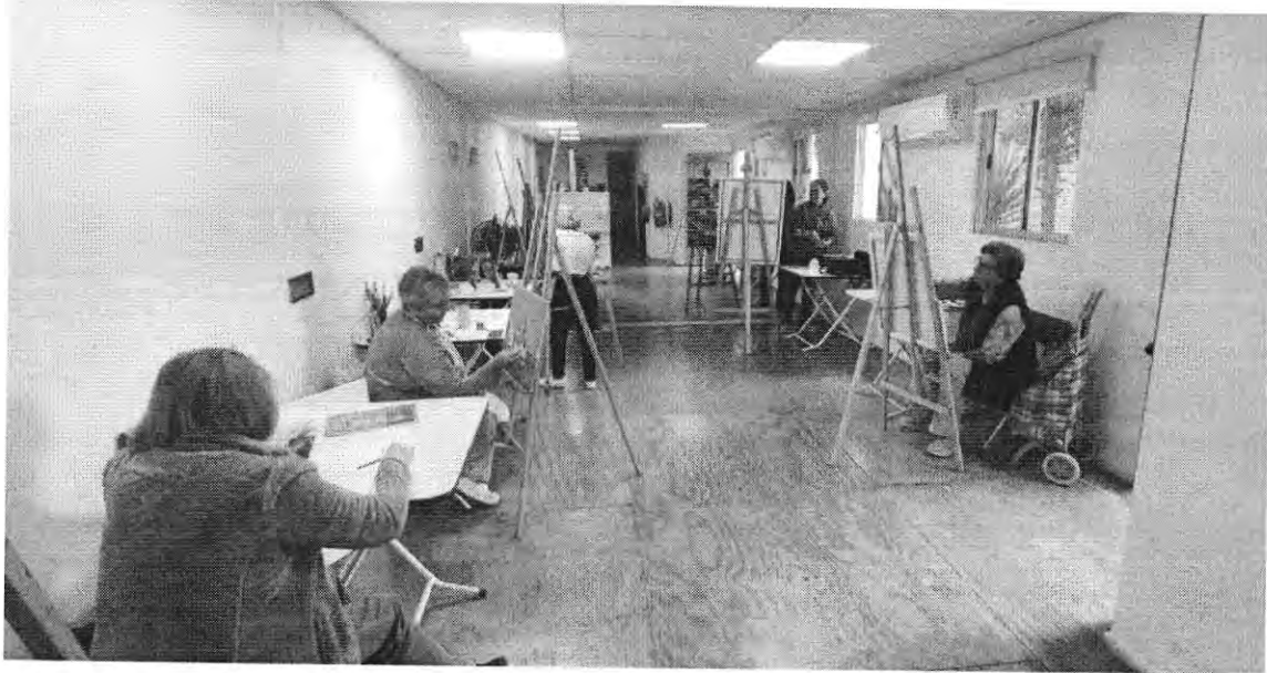
Pintura Óleo Intermedio El Canelo