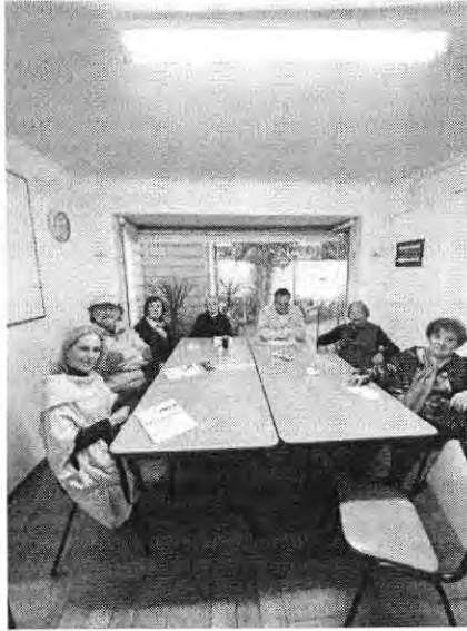
Taller de Historia Universal 7

Se debe especificar el taller correspondiente al medio de verificación.