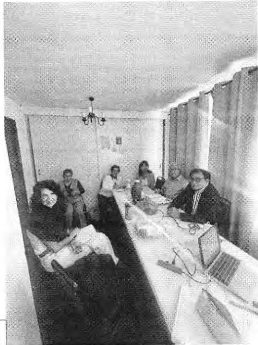
Taller de Historia Universal 5