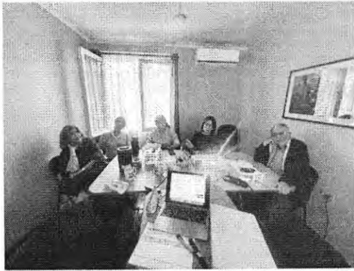
Taller de Historia Contemporánea 6