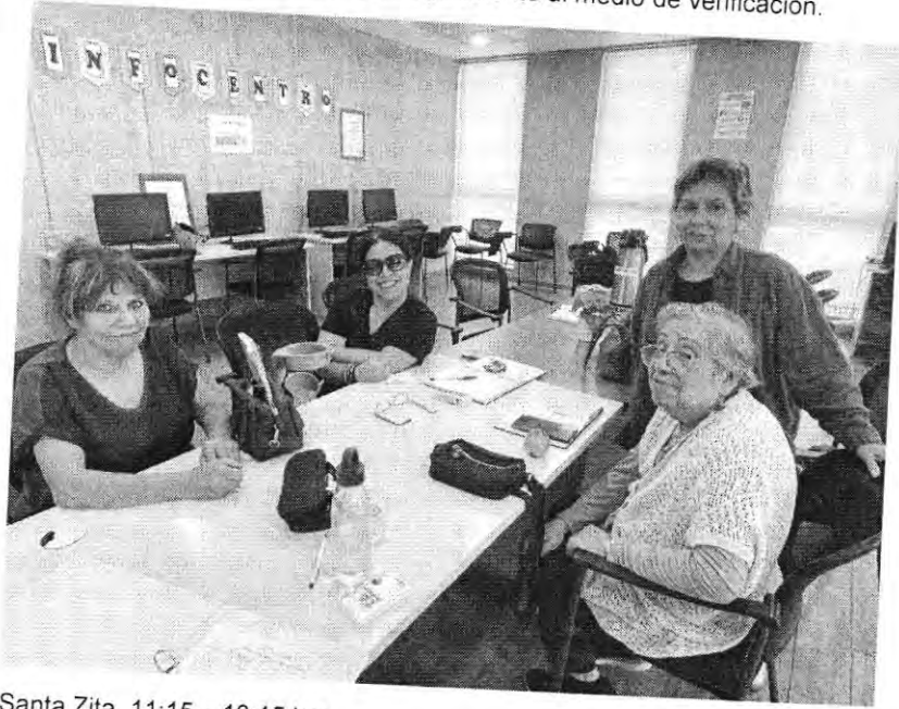
Santa Zita, 11:15 – 13:15 hrs.

Se debe especificar el taller correspondiente al medio de verificación.