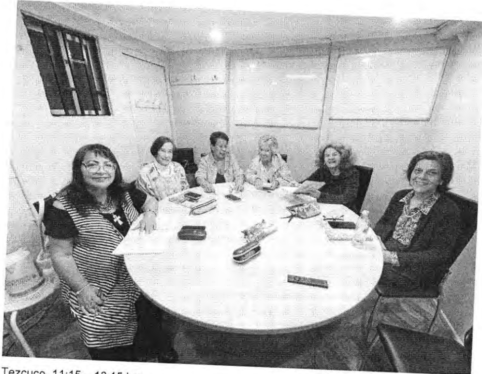
Tezcuco, 11:15 – 13:15 hrs.