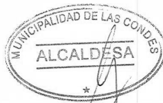
CATALINA SAN MARTÍN CAVADA