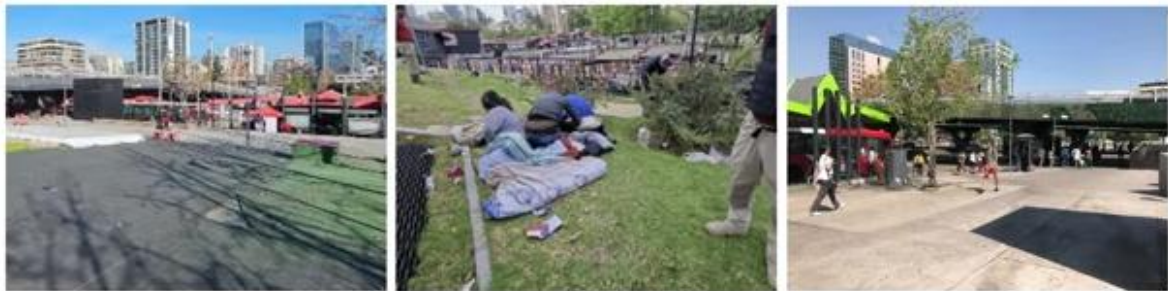
Falta de mantención y espacios deteriorados