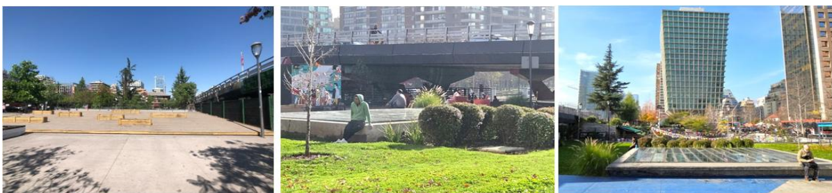
Reactivación del espacio público → mayor seguridad percibida