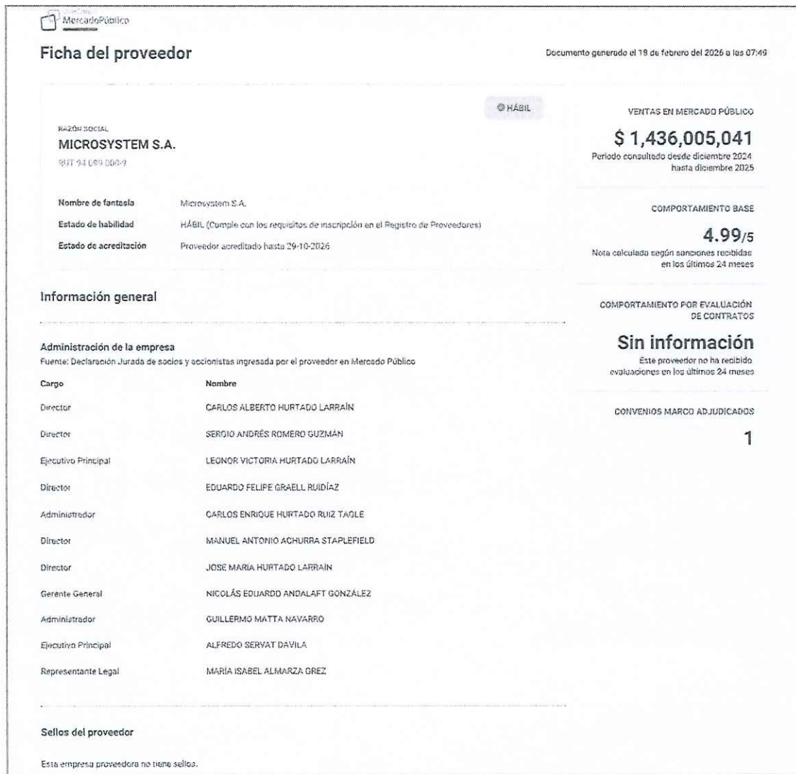
Ilustración 2. Ficha del proveedor, detallando el comportamiento base y los sellos que este tiene.