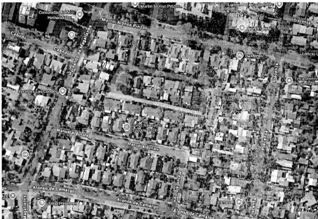
Ilustración 5 (Pasaje Martín Alonso Pinzón)