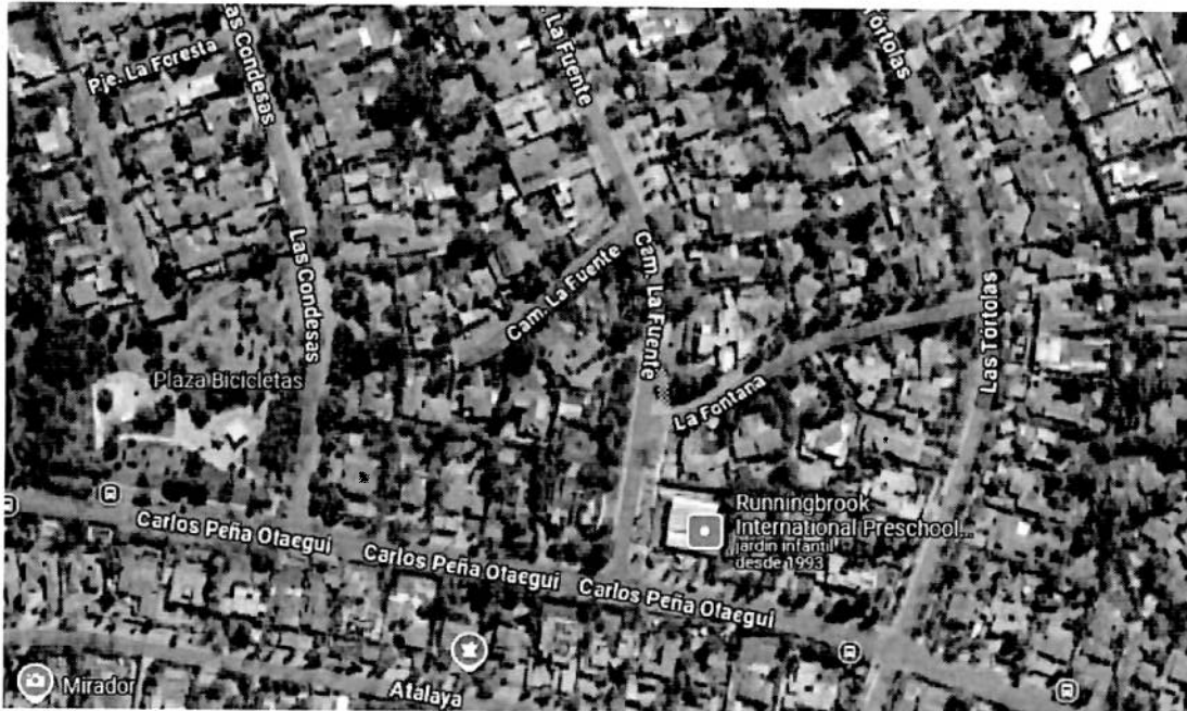
Ilustración 3 (Pasaje la Fontana, 60 metros aproximados)