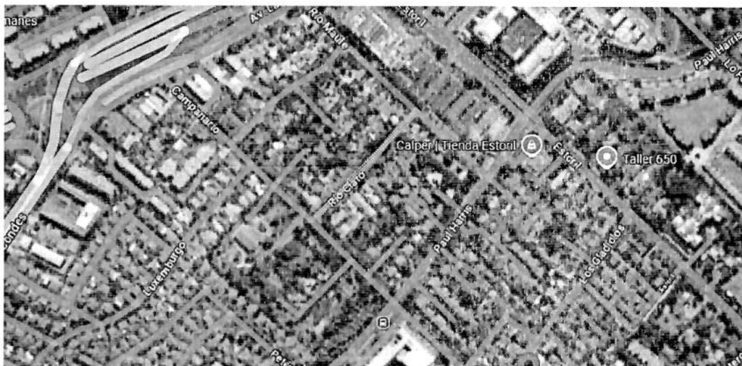
Ilustración 2 (Desde Río Maule hasta Campanario, 200 metros aproximados)