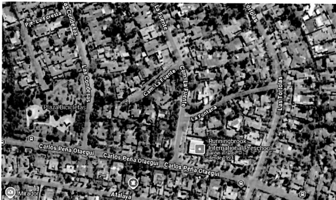
Ilustración 4 (Pasaje Sin Salida, Problemática al final del pasaje)