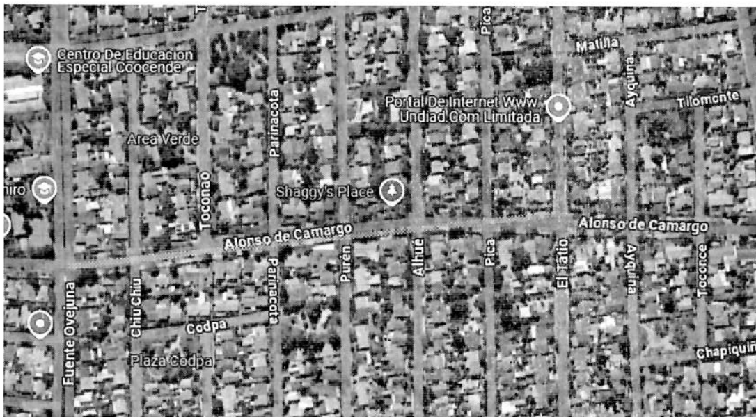
Ilustración 1 (Desde El Tatio hasta Fuente Ovejuna, 400 metros aproximados)