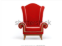
Imagen referencial sillón Viejo Pascuero