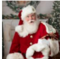
Imagen referencial Viejo Pascuero