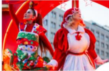
Personajes o corpóreos navideños