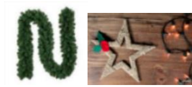
Imágenes referenciales decoración toldo