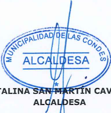
CATALINA SAN MARTÍN CAVADA ALCALDESA

ANÓTESE, COMUNÍQUESE, NOTIFÍQUESE, REGÍSTRESE Y ARCHÍVESE