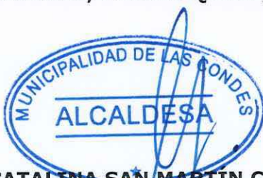
CATALINA SAN MARTÍN CAVADA ALCALDESA