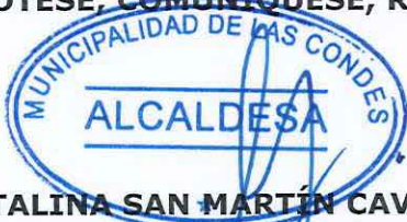
CATALINA SAN MARTÍN CAVADA ALCALDESA