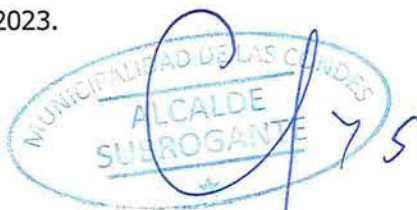
JUAN MANUEL MASFERRER VIDAL ALCALDE (S) MUNICIPALIDAD DE LAS CONDES

La personería de don JUAN MANUEL MASFERRER VIDAL , para actuar en representación de la Municipalidad de Las Condes en su calidad de Alcalde (S), consta en Decreto Alcaldicio Sección 1ª N° 74 del 13 de Enero de 2023.