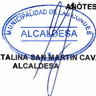
CATALINA SAN MARTIN CAVADA ALCALDESA