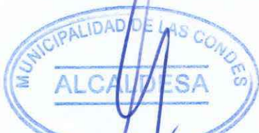
CATALINA SAN MARTIN CAVADA ALCADESA

3. Se deja expresa constancia, que la Municipalidad de Las Condes, a partir de la suscripción del Convenio que se aprueba, no asume ningún tipo de responsabilidad solidaria o subsidiaria, sea en el orden civil, penal, laboral contractual o extracontractual o de cualquier otro tipo, respecto de las deudas u obligaciones personales que eventualmente adquirieran los tenedores de Tarjeta Vecino de Las Condes para con Odontología y Estética Blanc SpA.