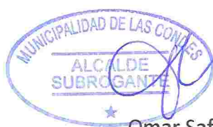
Omar Saffie Lamas Alcalde (S) Municipalidad de Las Condes