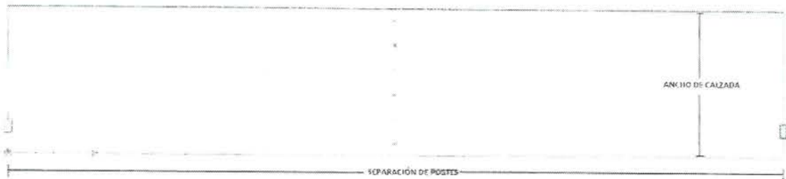
Trama de cálculo 1x6 para iluminancia a 1.5m.

Evaluación de iluminancia a 1,5 m: El oferente deberá realizar la simulación por medio de software computacional, el cumplimiento del requerimiento del Reglamento de Alumbrado Público de Vías de Tránsito Vehicular, Art. 18), letra b). Para la simulación se considerarán las mismas condiciones de software, montaje y factor de degradación que se indican en la tabla anterior. La trama de cálculo considera 6 puntos de medición (figura 2) a 1,5 m sobre el ancho de calzada, y equidistantes entre separación de mástiles o postes, estas condiciones son dadas por cada caso tipo. El oferente así también deberá adjuntar en la oferta los mismo archivos IES utilizados para realizar la simulación, para que la comisión evaluadora en caso que requiriese, pueda replicar la simulación realizada por el oferente.